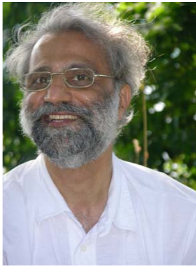
કવી વીરાફ કાપડીયા