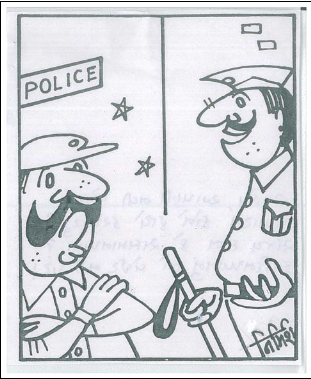
સાહેબ, આપણી નવી જેલનું ઉદ્ઘાટન કોને હાથે કરાવશું ? સંજય દત્ત કે સલમાન ખાન ? ફરદિનખાનનું તો વેઈટ નહીં પડે !

એક જમાનામાં કેન્યાનાં જનજીવનમાં હિન્દીઓ સક્રિય હતા અને આગેવાની પણ આપતા હતા, તેની સામે કોમ હવે કોરાણે ફેરવાઈ ચૂકી છે. હા, આ વસાહત કમાણી કરે છે અને વળી દાનધર્માદા ય કરે છે. પણ પહેલાંની જેમ વિરોધ પક્ષોને સહાયક ભાગ્યે જ થાય છે. હિન્દીઓ એક